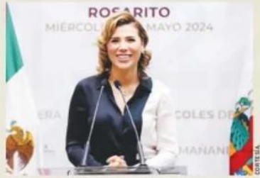
Marina del Pilar Ávila Olmeda, gobernadora.

Como resultado de su reciente gira por Asia se consiguió la instalación de dos nuevas plantas de esa región en Baja California, una de ellas en Mexicali, señaló la Gobernadora.