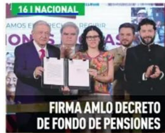
FIRMA AMLO DECRETO DE FONDO DE PENSIONES