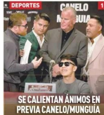
SE CALIENTAN ÁNIMOS EN PREVIA CANELO/MUNGUÍA